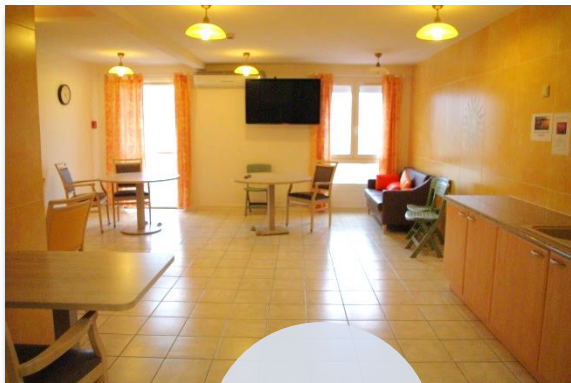
Salon du CANTOU