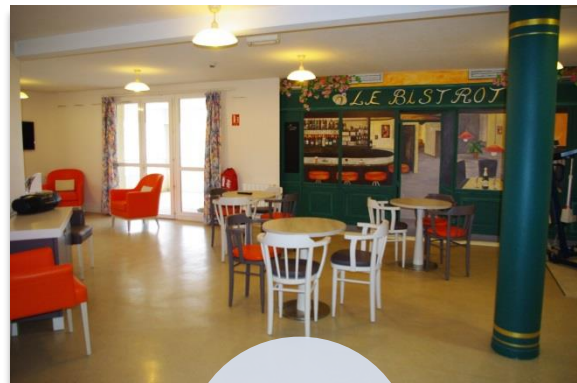
Salon 1 er étage

L'EHPAD de Ceyzériat dispose d'une grande salle à manger au rez-de-chaussée.