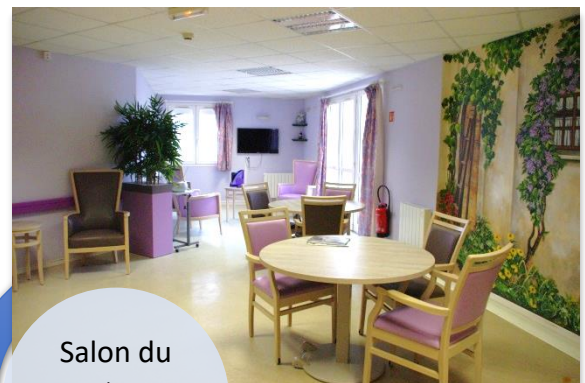
Salon du 3 ème étage