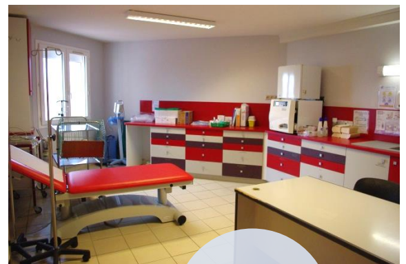
Salle de soins