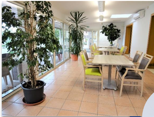
Salon du bas